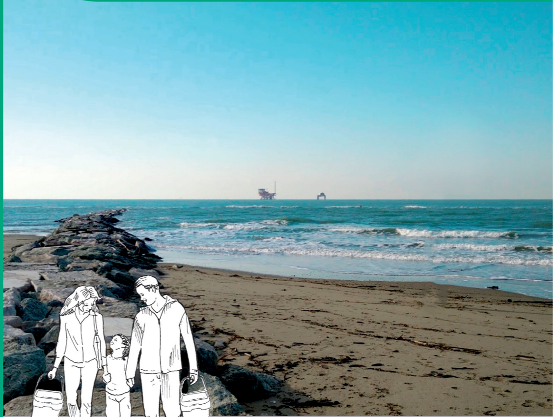
edizione dicembre 2015, stampato su carta ecologica - design: Koan multimedia

Servizio Clienti 800.999.500 chiamata gratuita da rete fissa e mobile attivo dal lunedì al venerdì dalle 8.00 alle 22.00, sabato dalle 8.00 alle 18.00