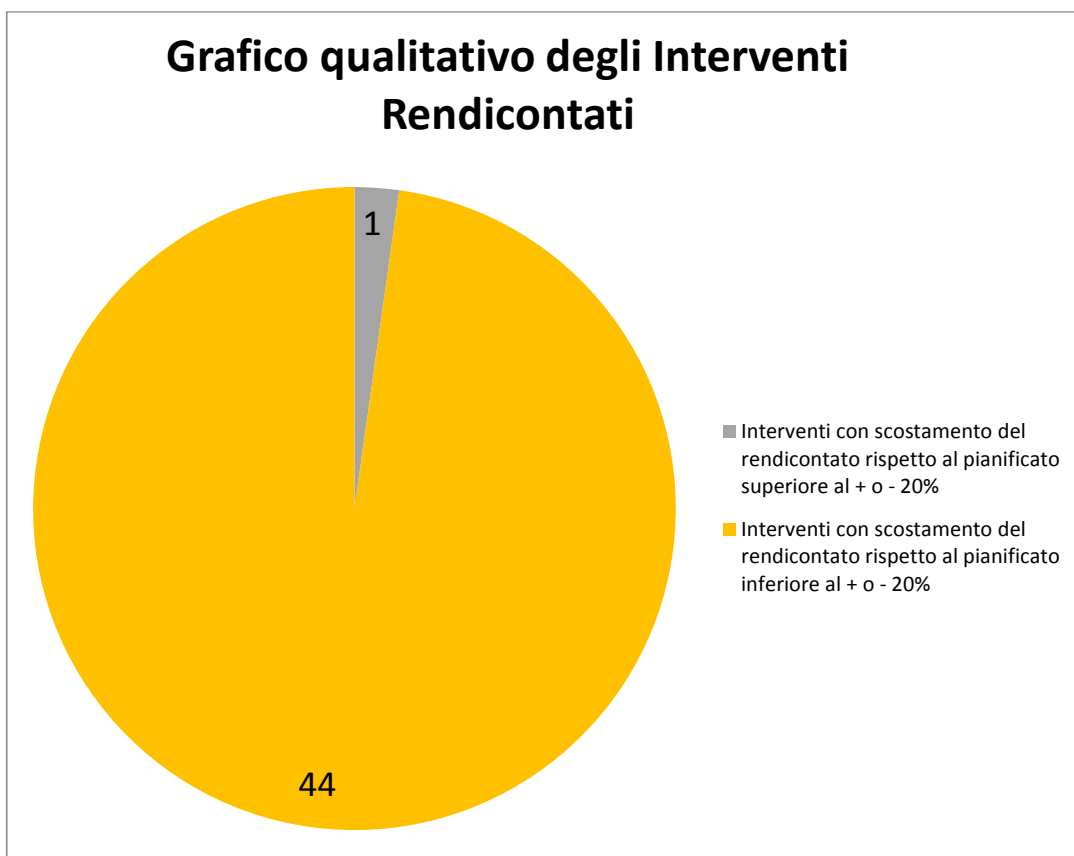
Fig.2 – Illustrazione qualitativa degli interventi avviati dal gestore e rendicontati