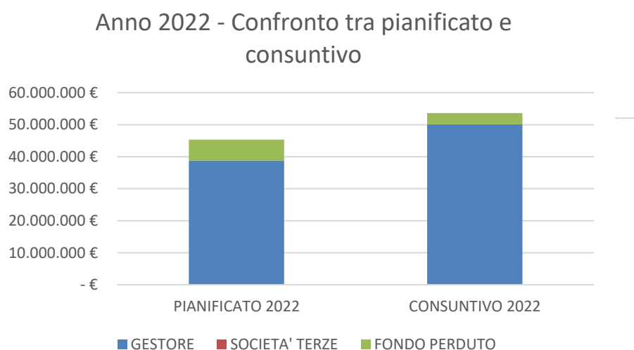
Fig. 1 – Istogramma di confronto tra quanto pianificato e quanto rendicontato nel 2022

Dalla tabella sopra riportata si nota come il gestore HERA abbia effettuato nel corso del 2022 investimenti superiori rispetto al pianificato per circa il 18%.