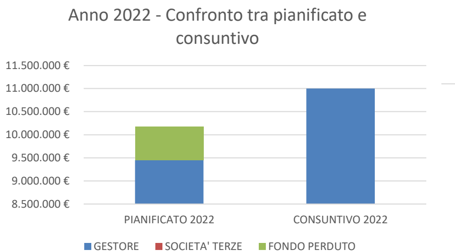
Fig.1 – Istogramma di confronto tra quanto pianificato e quanto rendicontato nel 2022

Dalla tabella sopra riportata si nota come il gestore CADF abbia effettuato nel corso del 2022 investimenti superiori rispetto al pianificato per circa l'8%.