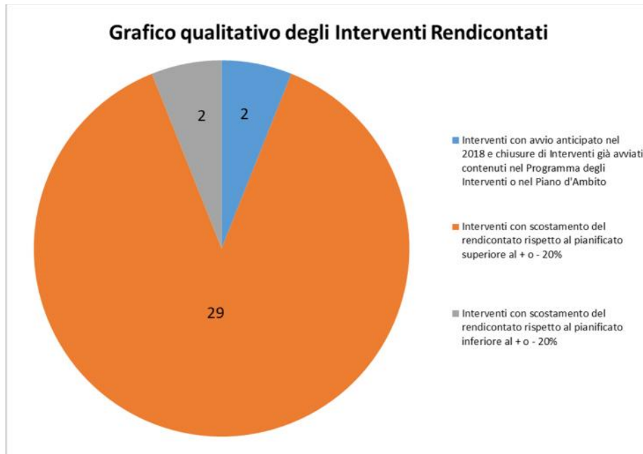
Fig.2 – Illustrazione qualitativa degli interventi avviati dal gestore e rendicontati

(€ 749.152), a dimostrazione comunque che, sebbene lo scostamento complessivo (€ 84.464 – cfr. Tab. 1) sia esiguo, la programmazione approvata non è stata seguita fedelmente dal gestore dal punto di vista degli importi.