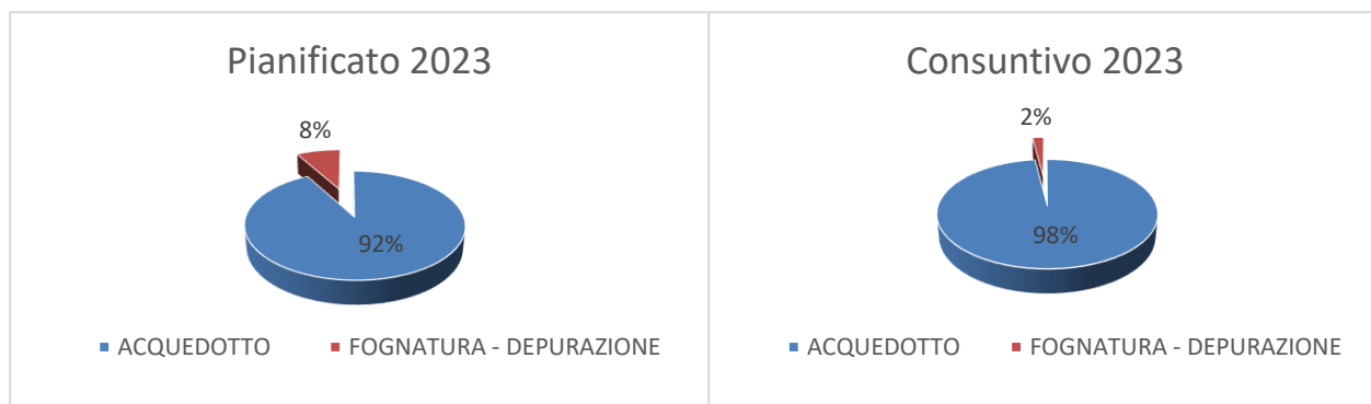
FIG.2 – Suddivisione investimenti 2023 per servizio

Gli investimenti realizzati nell'annualità 2023 sono stati suddivisi per categorie e rappresentati graficamente come segue: