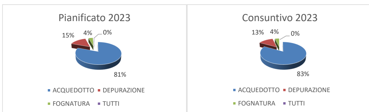
FIG.2 – Suddivisione investimenti 2023 per servizio

Gli investimenti realizzati nell'annualità 2023 sono stati suddivisi per categorie e rappresentati graficamente come segue: