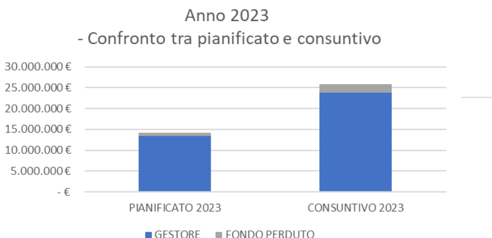
Fig.1 – Istogramma di confronto tra quanto pianificato e quanto rendicontato nel 2023

Dalla tabella sopra riportata si nota come il gestore IRETI abbia effettuato nel corso del 2023 investimenti superiori rispetto al pianificato per circa l'82%.