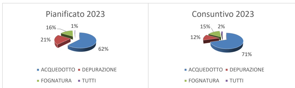
FIG.2 – Suddivisione investimenti 2023 per servizio

Gli investimenti realizzati nell'annualità 2023 sono stati suddivisi per categorie e rappresentati graficamente come segue: