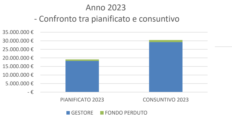
Fig.1 – Istogramma di confronto tra quanto pianificato e quanto rendicontato nel 2023

Dalla tabella sopra riportata si nota come il gestore IRETI abbia effettuato nel corso del 2023 investimenti superiori rispetto al pianificato per circa il 60%.