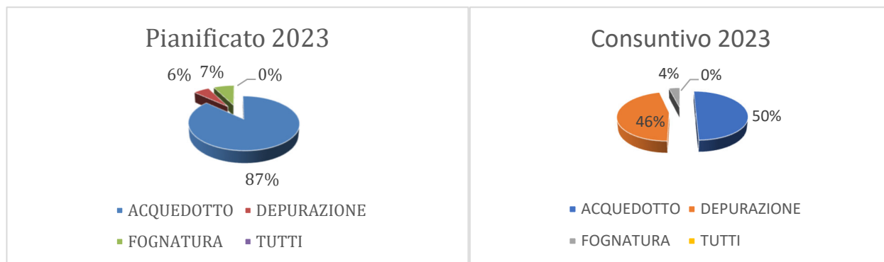
FIG.2 –Suddivisione investimenti 2023 per servizio

Gli investimenti realizzati nell’annualità 2023 sono stati suddivisi per categorie e rappresentati graficamente come segue: